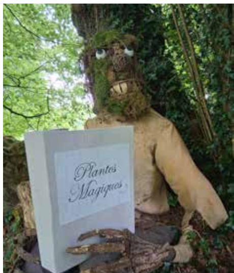
Mai 2025 - fête de la nature