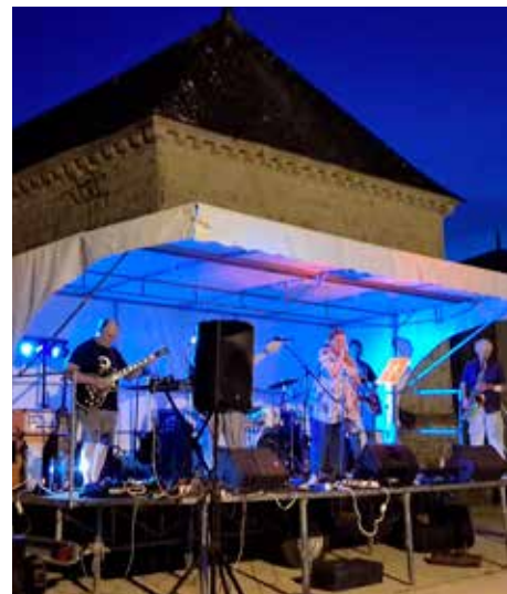
Juin 2025 - fête de la musique