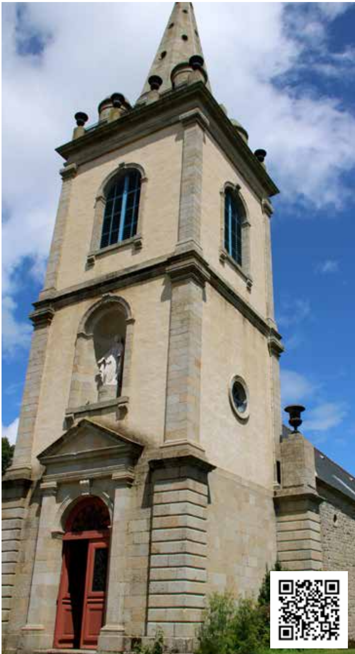
Chapelle Notre-Dame de Crénéan

Une carte du patrimoine de la Commune est également accessible sur le panneau de chaque site.