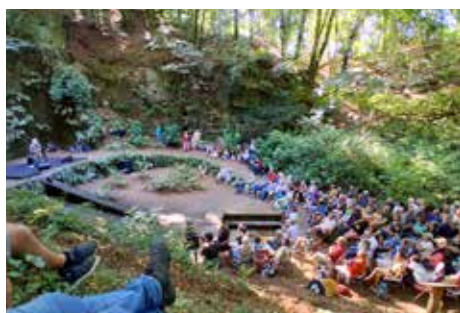
Août 2025 - Lieux mouvants