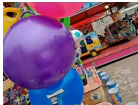
Avril 2025 - fête de Pâques