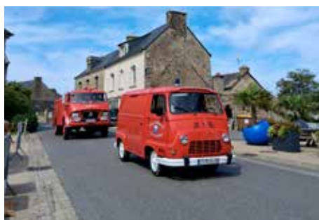
Septembre 2025 - fête des pompiers