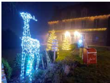
Décembre 2024 - marché de Noël

Parce que la culture rassemble et ouvre l'esprit, permet l'épanouissement et le vécu d'émotions. Parce que le monde associatif et le bénévolat réunissent des personnes différentes autour d'une même énergie positive. Parce que nous vivons dans une commune qui permet l'expression personnelle au service du collectif. L'année écoulée fut une fois de plus riche et diverse. Pour vous. Avec vous. Quelques-uns de ces moments partagés en images :