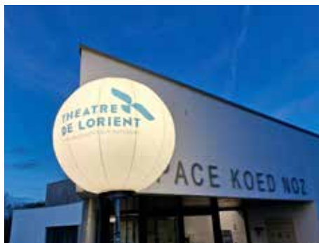
Mars/Novembre 2025 - théâtre de Lorient